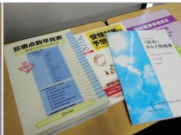
基礎から学ぶ医療・調剤事務養成科