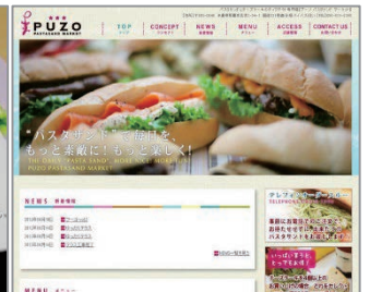
Web制作スキルマスター科