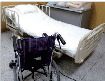
介護職員初任者養成科