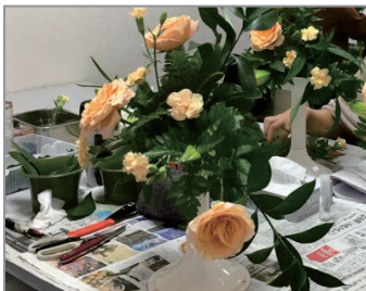
花の販売・デザイナー養成科