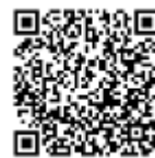
対面会場アクセス

受講料は、お申し込み後にTCE財団より送付される請求書に基づき、お振込みをお願いいたします。